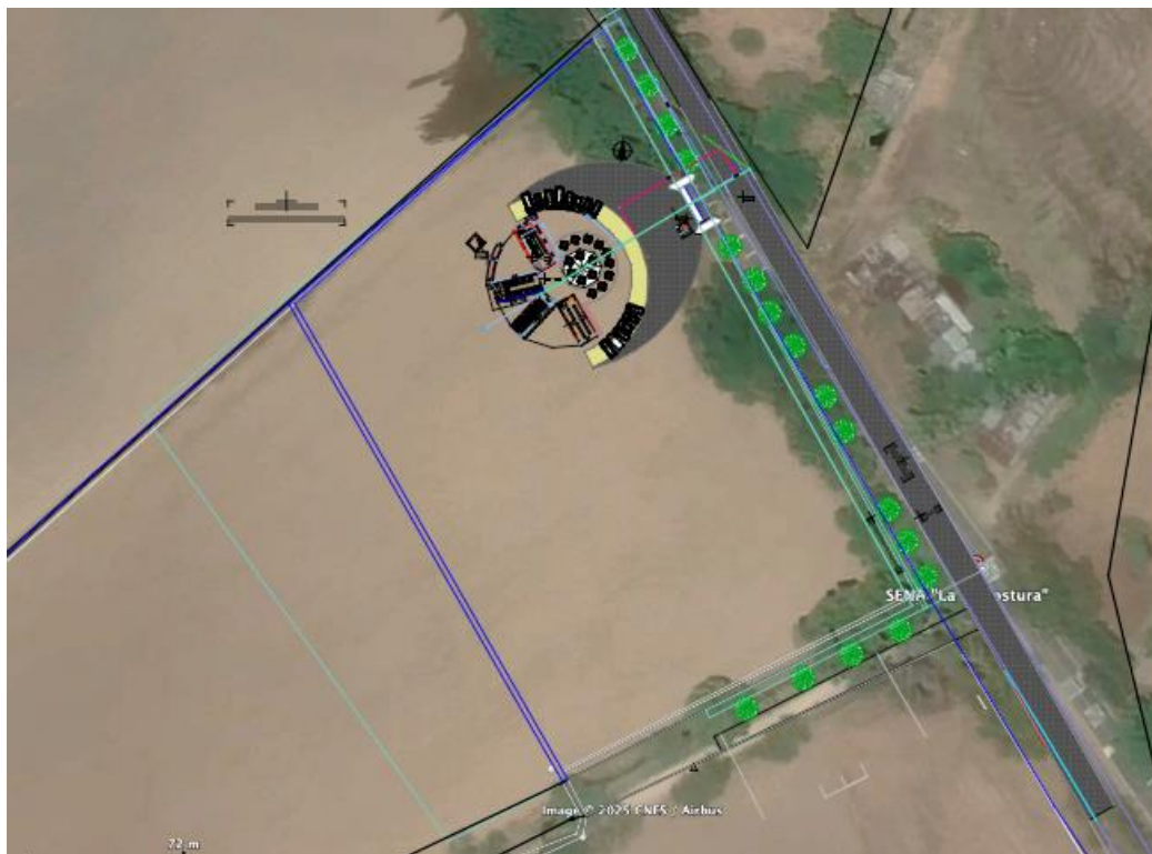
Ilustración 3. Localización.