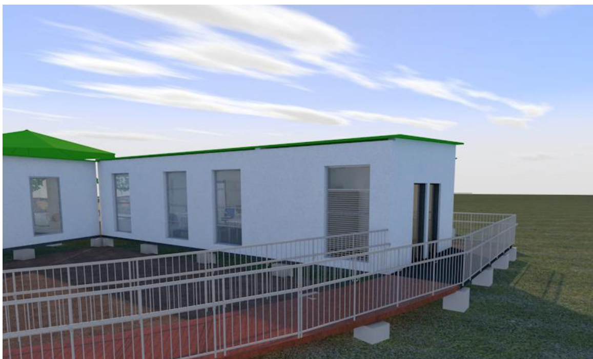
Ilustración 1. Imagen ilustrativa en 3D del ambiente

Ambiente no Convencional, tipo contenedor marítimo, conformado por dos (2) containers HIGH CUBE de 40 pies unidos longitudinalmente y con todas las especificaciones técnicas de recubrimiento, iluminación, cableado estructurado, instalaciones eléctricas de energía regulada y comercial según la normatividad vigente, puntos de conexión hidráulica, sanitaria, puertas, ventanas y climatización artificial.